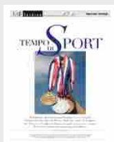
Tempo di Sport