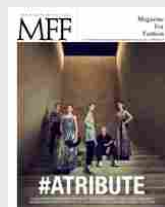
MFF 77 - #Atribute/#Tommy3Bccentrico