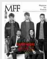
MFF 78 - Caput Modae/House of Kors