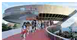
La febbre carioca di Louis Vuitton