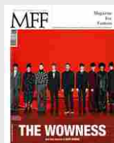
MFF 80 - The wowness