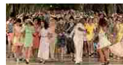
La rivoluzione cubana di Chanel