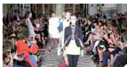
L'anglomania di Dior