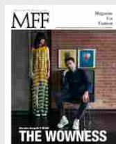
MFF 79 - The wowness