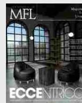
MFL 36 - EcceNTRICO