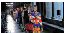
Britextravaganza à la Gucci