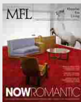
MFL 37 - Nowromantic