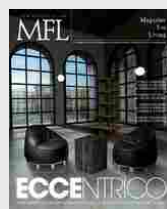
MFL 36 - EcceNtrico