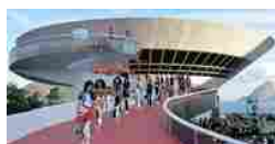
La febbre carioca di Louis Vuitton