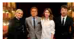
Valentino conquista Roma con una Traviata d'autore