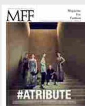
MFF 77 - #Atribute/#Tommy3Bccentrico