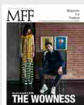
MFF 79 - The wowness