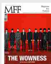
MFF 80 - The wowness