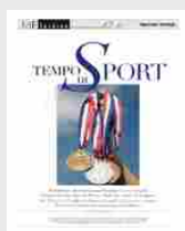
Tempo di Sport