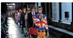
Britextravaganza à la Gucci