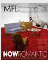
MFL 37 - Nowromantic