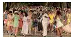
La rivoluzione cubana di Chanel