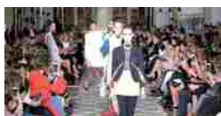
L'anglomania di Dior