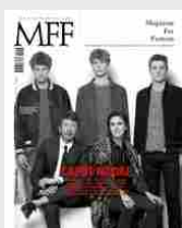
MFF 78 - Caput Modae/House of Kors