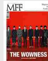
MFF 80 - The wowness