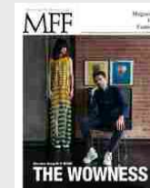
MFF 79 - The wowness