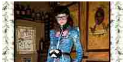
La nuova Gucciland