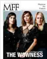
MFF 81 - The wowness