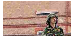
McCartney battezza l'uomo