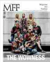
MFF 82 - The wowness