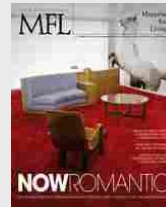
MFL 37 - Nowromantic