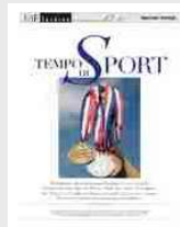
Tempo di Sport