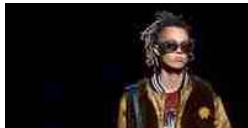
L'uomo prepara una stagione di trasformazione