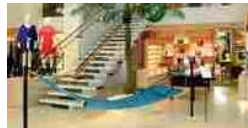
Louis Vuitton alle grandi manovre sul design