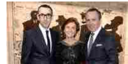
Zegna parte da Londra la rivoluzione di Sartori