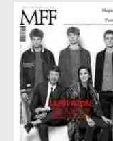
MFF 78 - Caput Modae/House of Kors