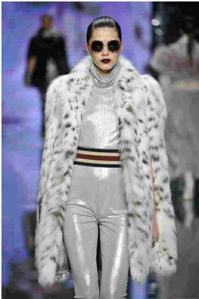
TheOneMilano - Italian Fur Fashion Night