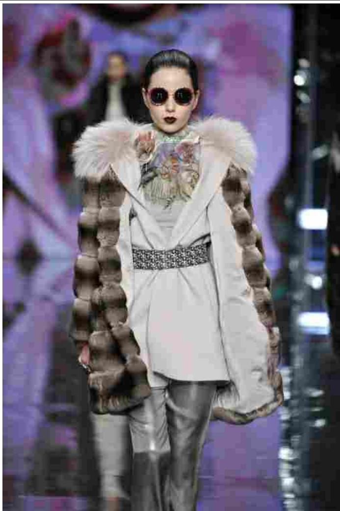
TheOneMilano - Italian Fur Fashion Night