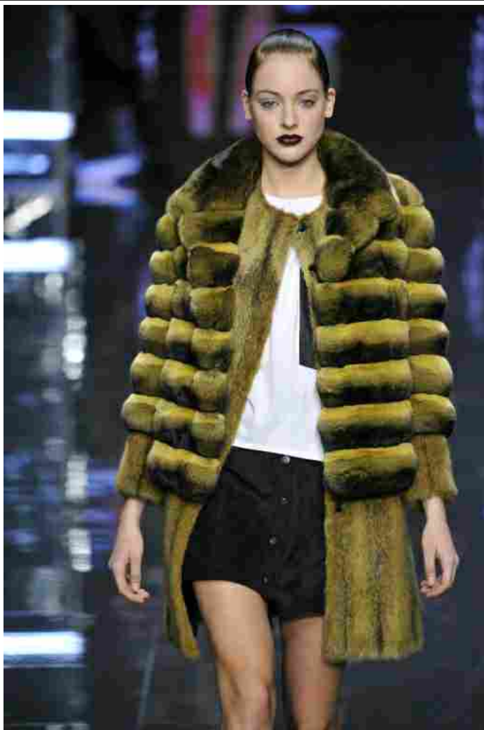
TheOneMilano - Italian Fur Fashion Night