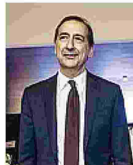
Città Beppe Sala, sindaco di Milano