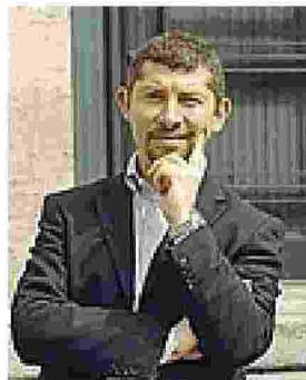
Governmento Ivan Scalfarotto, sottosegretario Mise