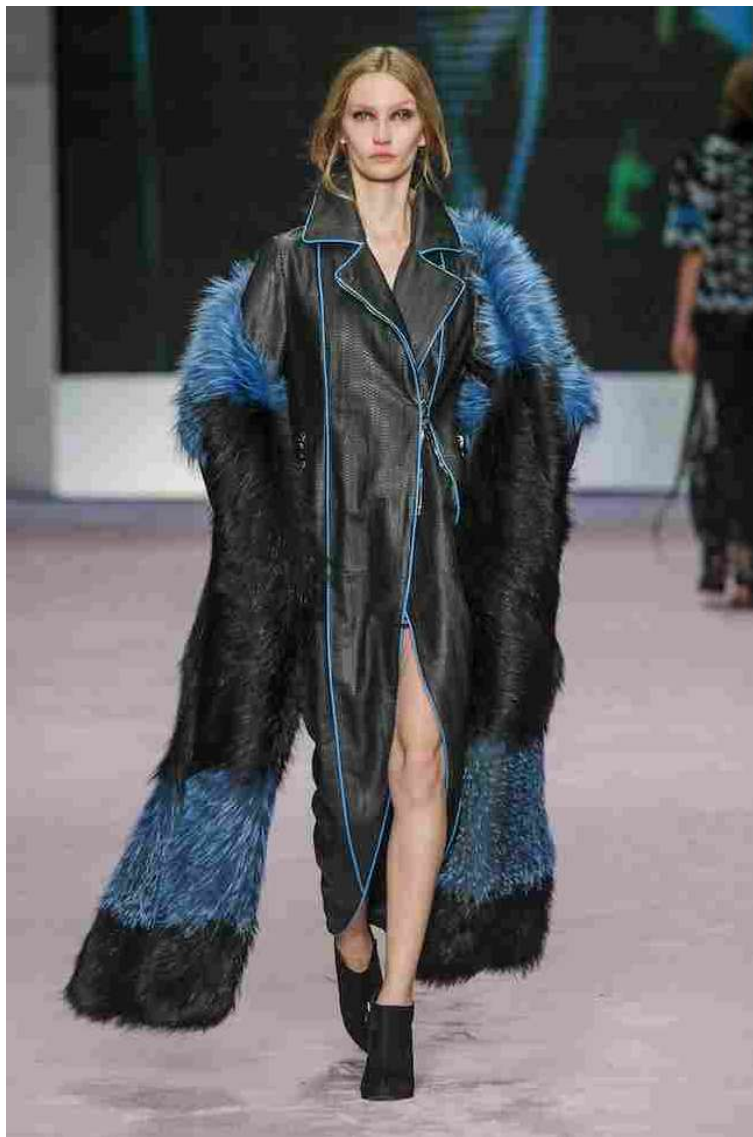
Giorgio Magnani Luxury