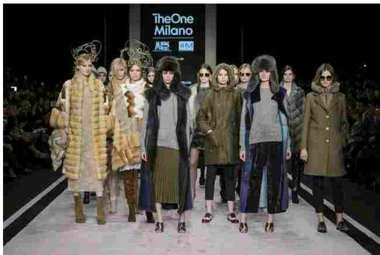
Il gran finale della "Italian Fur Fashion Night" con le creazioni realizzate per la

Alla Fashion Hall di Via Burigozzo 6 a Milano, 8 brand italiani e 3 nuovi talenti internazionali sono saliti in passerella per celebrare, con la sfilata "Italian Fur Fashion Night", realizzata in collaborazione con AIP-Associazione Italiana Pellicceria, la nascita di TheOneMilano, il nuovo salone moda milanese dedicato all'haut-à-porter e a collezioni ricche di qualità, di capacità di selezione della materia prima, di attualissimo saper fare, nato dalla fusione fra MIPAP e Mifur.