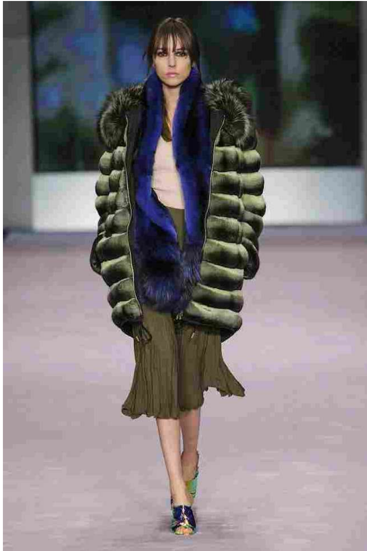
Gianfranco Ferré Furs