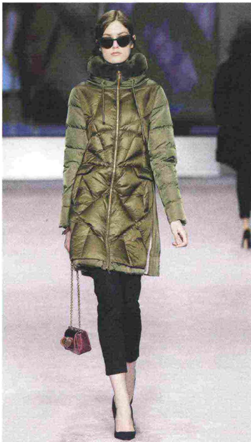
DIEGO M ↑ Piumino military style con collo in pelliccia per l'outfit protagonista sulla pedana dell'Italian Fur Fashion Night

Fieramilanocity hosted the first edition of the show born from the synergy between Mipap and Mifur. On stage clothing and fur