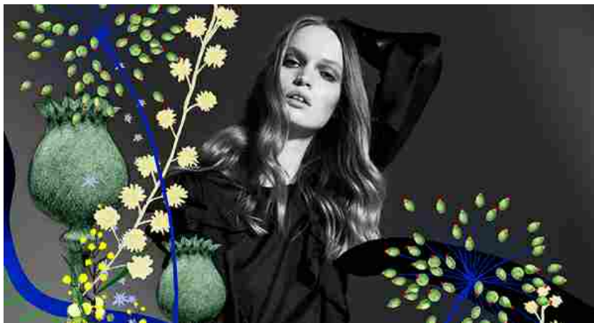
Un'immagine di TheOneMilano

TheOneMilano scalda i motori in vista della sua seconda edizione, in calendario dal 23 al 25 settembre a Fieramilanocity durante i giorni di Milano moda donna . Il salone, nato dall'unione tra Mifur e Mipap , è pronto a bissare il successo della sua prima prova di febbraio, durante la quale 286 aziende di abbigliamento in tessuto, maglieria e pelliccia avevano attirato oltre 11 mila buyer, il 63% dei quali provenienti dall'estero. In particolare, l'ex Urss e l'Estremo Oriente sono state le aree più rappresentate, rispettivamente con una quota pari al 16% e al 15 per cento.