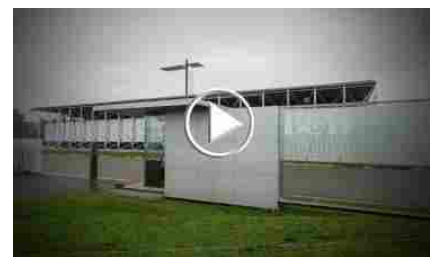
B&B Italia investe in innovazione con Lectra