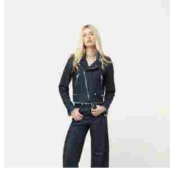
Roy Rogers - SS18