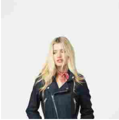
Roy Rogers - SS18