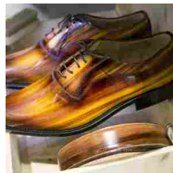
TheOne Milano - SS18