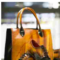
TheOne Milano - SS18