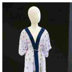
TheOne Milano - SS18