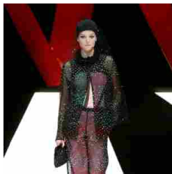
Giorgio Armani Womenswear SS18