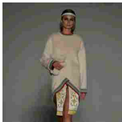
SpringSummer 18 Ready to wear collection fashion week in Milan