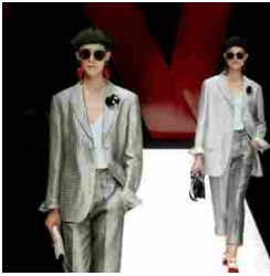
Giorgio Armani Womenswear SS18