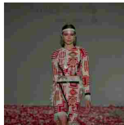
SpringSummer 18 Ready to wear collection fashion week in Milan