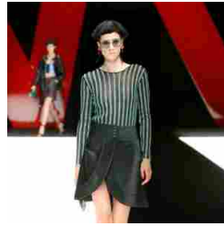
Giorgio Armani Womenswear SS18