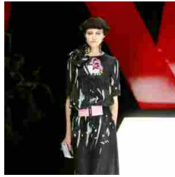
Giorgio Armani Womenswear SS18