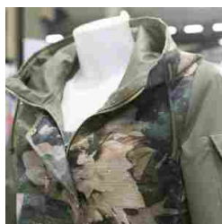
TheOne Milano - SS18