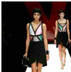
Giorgio Armani Womenswear SS18