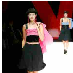
Giorgio Armani Womenswear SS18