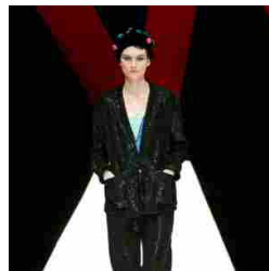
Giorgio Armani Womenswear SS18