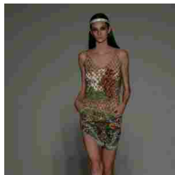
SpringSummer 18 Ready to wear collection fashion week in Milan