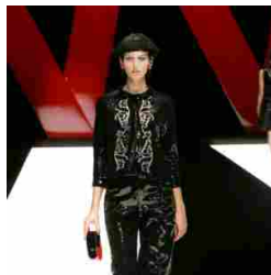
Giorgio Armani Womenswear SS18