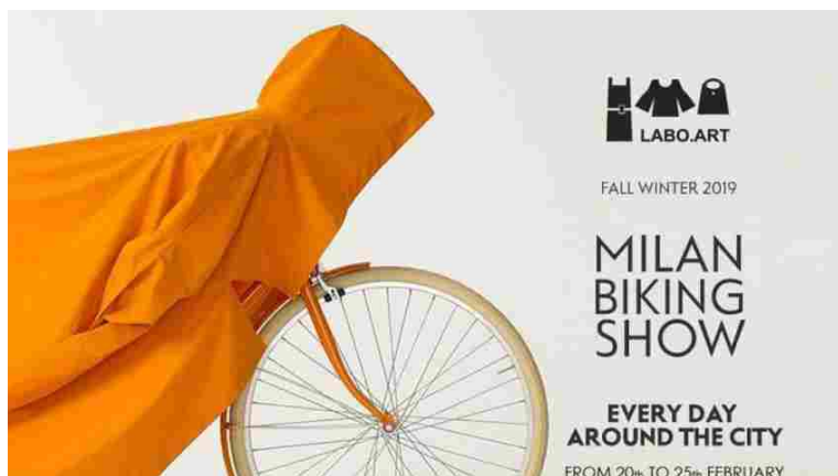
Milan Biking City

Abiti per le grandi occasioni" a Palazzo Morando, visitabile fino al prossimo 4 novembre. Da non perdere l'esposizione "Rick Owens. Subhuman, Inhuman, Superhuman" alla Triennale Design Museum aperta fino al 25 marzo. Inoltre, se siete appassionati dello stile di Frida Khalo vi suggeriamo di non perdere la mostra dedicata all'artista messicana, in scena al Mudec fino al 3 giugno.