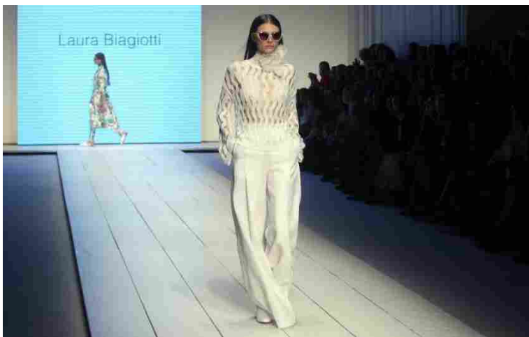
Sfilata Laura Biagiotti alla Milano Fashion week

ore 20:00 VERSACE, Piazza Duomo – Scalone Arengario