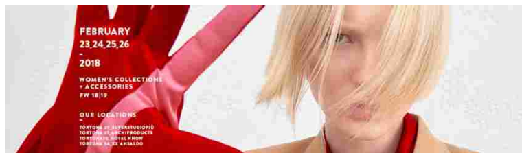
White Milano 2018

Torna il White Milano 2018 dal 23 al 26 febbraio e in questa occasione vedremo collezioni e accessori per l'autunno/inverno 2018-2019. Le location di questa edizione sono gli spazi Superstudiopiù, Archiproducts, Hotel Nhow e Ex Ansaldo, tutti in zona Tortona. All'interno delle 4 location sarà possibile ammirare le proposte di brand emergenti, consolidati, di tendenza e Made in Italy.