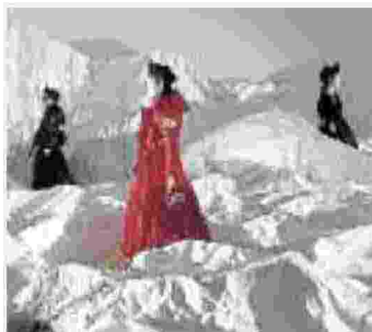
SULLA NEVE Una proposta per la stagione fredda Moncler