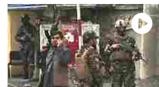
Tre attentati in Afghanistan, uno contro sede dell'intelligence