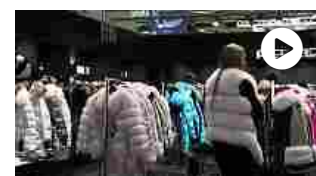
Vento di rivoluzione al salone haut-à-porter The One Milano