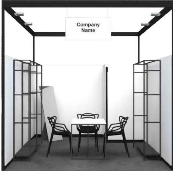
STAND PREALLESSTITO - UN LATO APERTO SHELL SCHEME SOLUTION - ONE OPEN SIDE