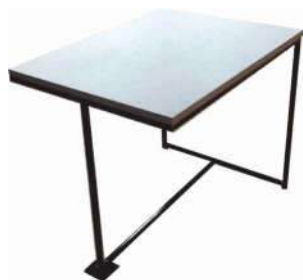
Sedia "Masters" / "Masters" chair