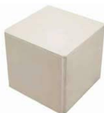
Pouf / Footstool dim. 50x50xH50cm