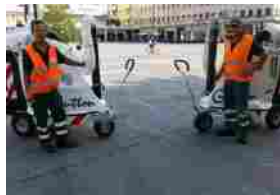
Pescara, due nuovi aspiratori per pulire aiuole e marciapiedi