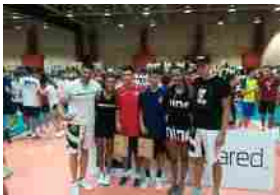
Le stelle della pallavolo a Montesilvano, serata di premiazioni