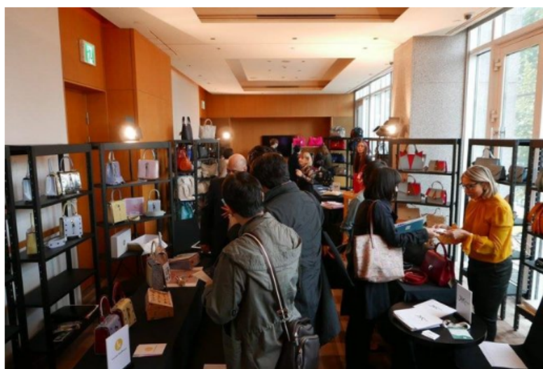
L'edizione di ottobre 2017 di "Mipel Leather goods Showroom in Corea"

La rassegna sul mondo della pelletteria Made in Italy torna in Corea, a Seul, negli spazi del Park Hyatt Hotel di Gangnam, dal 16 al 18 ottobre, con ben 34 aziende e un ampliamento dell'offerta merceologica che in questa edizione vedrà protagonista anche la pellicceria.