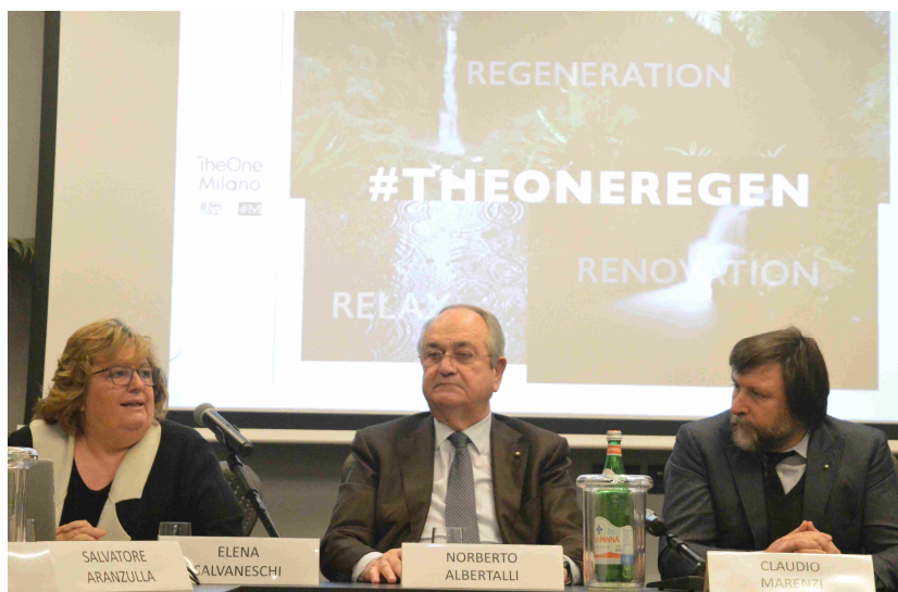
Conferenza stampa presentazione The One Milano