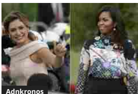
Adnkronos Michelle & Michelle, stili a confronto

Articoli correlati Di più dello stesso autore