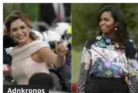
Adnkronos Michelle & Michelle, stili a confronto