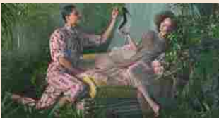
EVENTI DI SETTORE | 7 febbraio 2019

Decisamente positivi i numeri di Super , salone di Pitti Immagini dedicato all'abbigliamento e agli accessori di ricerca, che dallo scorso anno è tornato in via Tortona, facendo squadra con White. Le stime fornite da Pitti parlano di 5.700 compratori, in salita del 21% rispetto alla precedente edizione invernale (quella di febbraio 2018, che si era svolta al The Mall di Porta Nuova). Tra i buyer internazionali, che rappresentano il 20% circa del totale, le performance migliori sono state quelle di giapponesi, francesi, tedeschi, svizzeri, americani e cinesi.