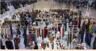
NON SOLO SFILATE | 22 febbraio 2019

Milano punta sulle fiere per attirare buyer stranieri