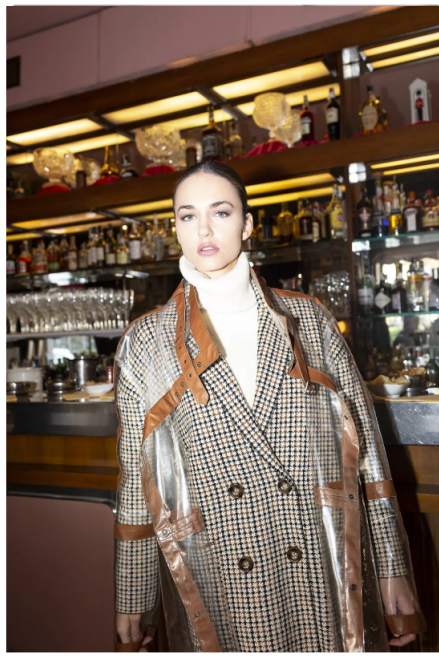
4/8 Giacca Artico