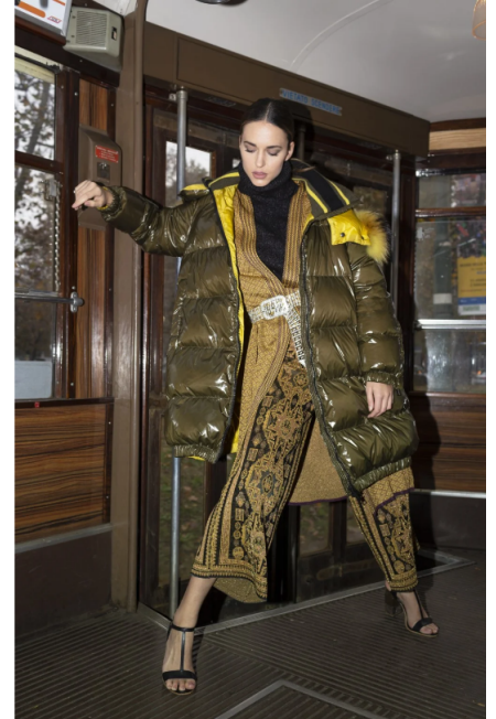
7/8 Giacca Nipol