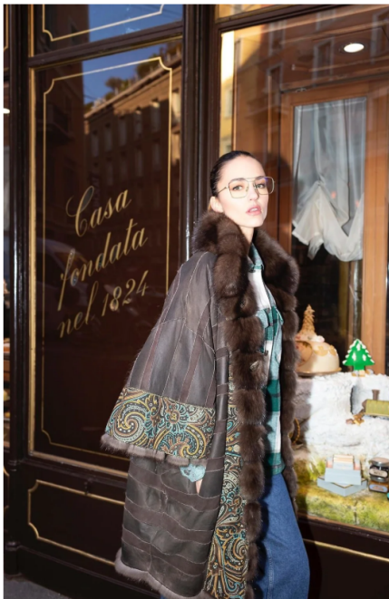
3/8 Giacca Tosato