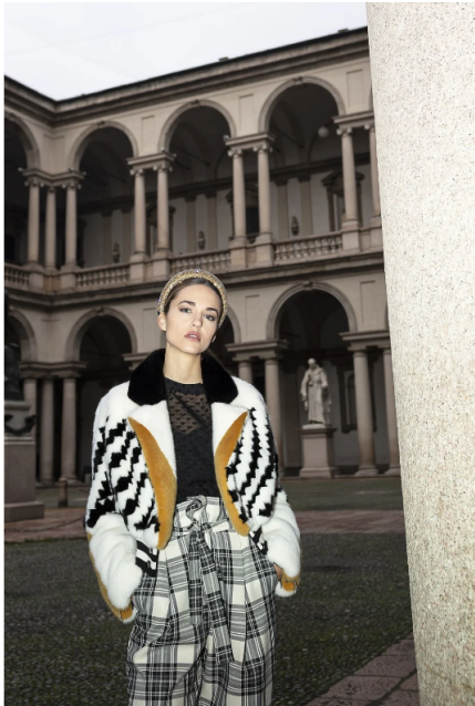
2/8 Giacca Fabio Crovazzi