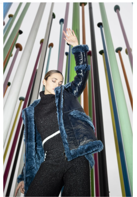
8/8 Giacca Manzoni24