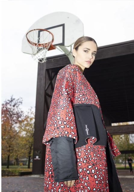
5/8 Giacca e tuta Oblique Creation