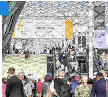
Affollamento agli ingressi dei padiglioni del Simac 2022

Sono i numeri che confermano il trend positivo, a partire da quelli delle aziende espositrici presenti sui 13mila metri quadrati della fiera. Italia soprattutto, ma anche Turchia, Francia, Germania, Portogallo, Brasile, Messico, Spagna e India tra le 86 nazioni di provenienza dei visitatori. Un'affluenza molto rilevante e più qualificata rispetto alla scorsa edizione, affermano gli organizzatori, con più di 4.000 accessi a cui vanno a sommarsi quelli attratti dalla potente sinergia tra le fiere meneghine che si è rinnovata quest'anno e che ha reso Milano il centro del mondo della filiera fashion. Proprio il richiamo delle fiere unite è stato trainante e decisivo