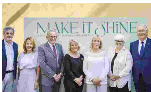
Un momento della presentazione delle otto fiere del settore moda che si svolgeranno in settembre a Milano